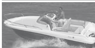
Cap Camarat 6.5 WA