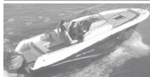
Cap Camarat 7.5 WA