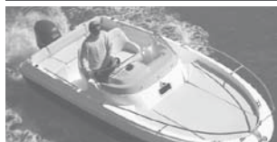
Cap Camarat 5.5 WA